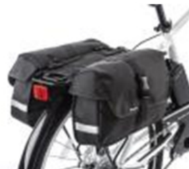
専用オプションのパニアバック ※画像は他車種の搭載イメージです。