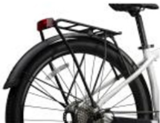
利用シーンの幅が広がる アルミドロヨケ、アルミリヤキャリア