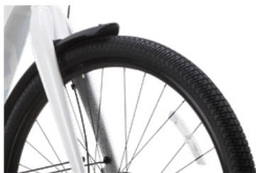
幅広い路面環境に対応した 50mmワイドタイヤ