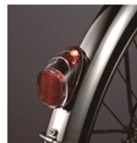
「ソーラーオートテール2」