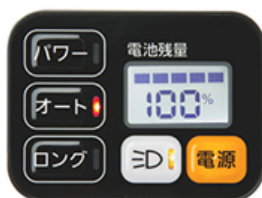
簡単操作で使いやすい新型手元スイッチ「らくらくスイッチ」

本製品には使いやすさを高めた新開発の「らくらくスイッチ」を採用しました。アシストモードの切り替えは、手元スイッチ左部の3つの大きなボタンで操作でき、お好みのアシストモードに簡単に切り替えが可能です。また、電池残量はシンプルな%表示と液晶上部の目盛りで確認することが出来ます。