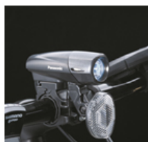
「LEDスポーツバッテリーライト」

従来のLEDスポーツバッテリーライトは、暗くなると自動で点灯する仕様でしたが、本製品では電源を入れると常時点灯する仕様を採用しました。これにより、夜間だけでなく昼間でも自動車や歩行者からの被視認性を高め、安全性に配慮しました。また、テールライトには周りの明るさと振動を感知して自動点滅するソーラーオートテール2を搭載しています。