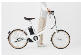
スタイリッシュでも乗り降りしやすい「アルミWストレートフレーム」

スタイリッシュなフレーム形状を保ちながら、またぎやすさに配慮したフレーム高さで、女性や身長がそれほど高くない男性でも自然に乗り降りすることが可能です。