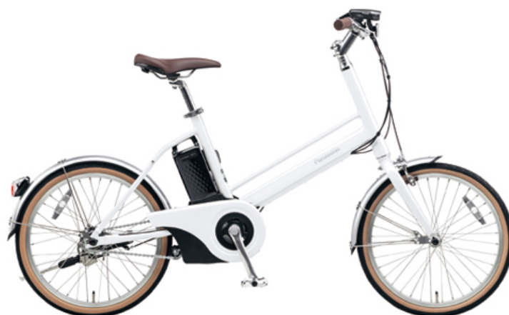
BE-JELJ01F (クリスタルホワイト)