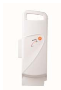
ホワイトバッテリー