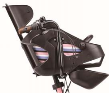
マルチカラーシートクッション

自転車もファッションの一部と考える消費者の声にお応えし、従来のポップなカラー、マットなカラーに加えフェミニンなカラーを追加した全8色を展開し多様な子育てママ・パパの好みに対応します。全8色展開のうち、アクティブホワイトとエアリーピンクの2色にホワイトのバッテリーを、エアリーピンクとビターブラウンにはマルチカラーシートクッションを搭載。見た目の爽快感や軽快感を演出します。シートクッションは肌ざわりもよく、撥水コーティングで雨や汚れを防ぎます。