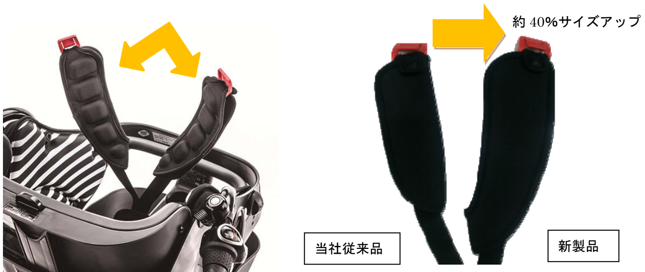
まめびたパッド裏側

お子さまを乗せる両親の快適性だけでなく、お子さまの事故防止と快適性も実現しました。