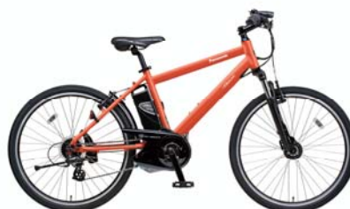
ハリヤ(BE-ENH544) <K: ラセットオレンジ>