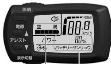
バッテリー(電池)残量 インジケーター バッテリー(電池)残量(%)