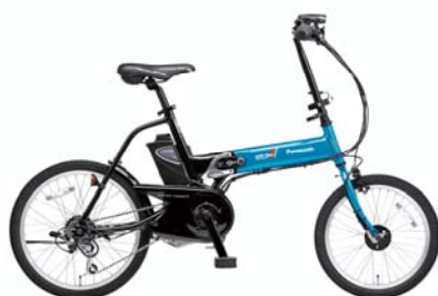
オフタイム(BE-ENW075) <V2: ターコイズ×ブラック>