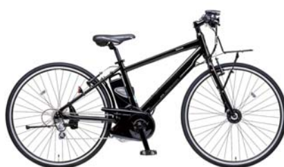
ジェッター (BE-ENHC544) < B: キャンディメタリックブラック >