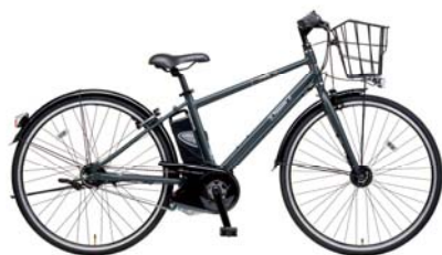
モビエイト(BE-ENHE782) <N: マットアースグレー>